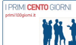
MANAGER Sette regole da discutere